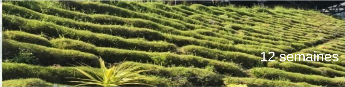
4 ème Etape: Adaptation et Evolution